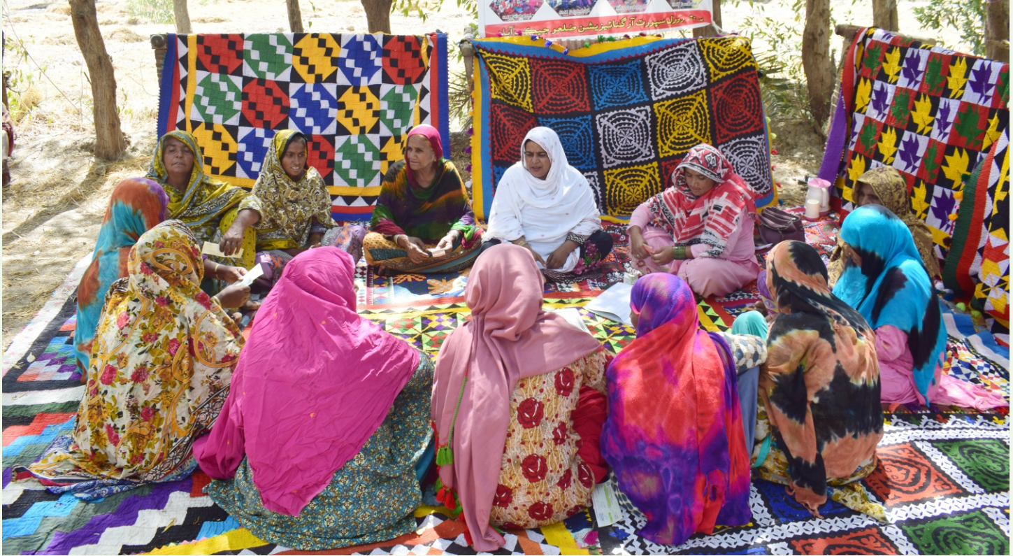
مسئلي جي حساسيت سمجهڻ ۾ اچي ٿي.

ماڻهن کي گڏ ڪرڻ ۽ انهن جي قابليت وڌائڻ جو احساس ڏيارڻ (Realizing): جڏهن ڪميونٽي ڪنهن